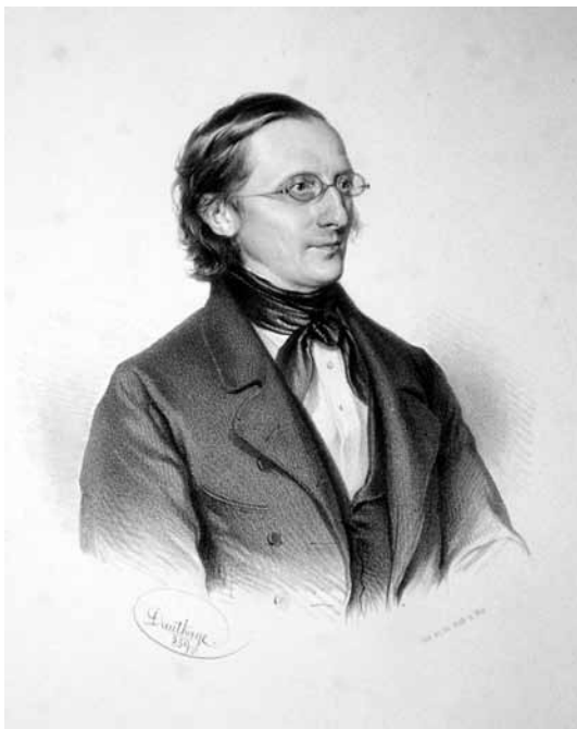
Carl Ludwig (1816-1895)

Ludwig nació en Alemania, en Witzenhausen sobre el Wesser, cerca de Kassel, en el año 1816. Su padre había participado en las guerras napoleónicas. Al terminar su formación básica, la cual cursó en el Gymnasium , entró a seguir la carrera de medicina en la Universidad de Marburg, en donde recibiría el doctorado en medicina en el año 1839.