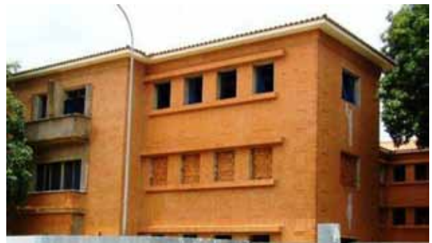
Hospital Central de Valencia

El nuevo hospital surge en junio de 1949 para enfrentar el reto de las demandas crecientes de asistencia médica planteadas por el incremento demográfico y la necesidad de disponer de un centro de docencia regional destinada a la formación del personal médico y paramédico requerido, para estructurar la creación de los Departamentos de Medicina, de Cirugía y